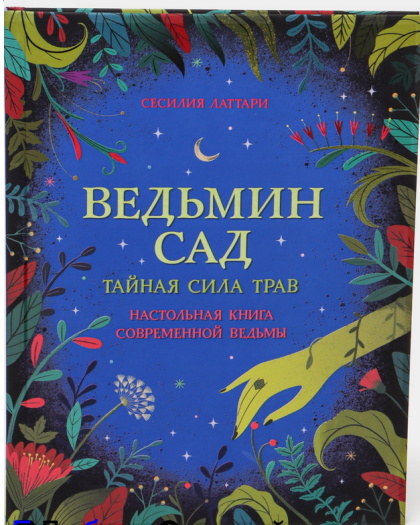
Познавательная литература: новинки - ВЕДЬМИН САД. Тайная сила трав. Настольная книга современной ведьмы / С. Латтари / Бигрос