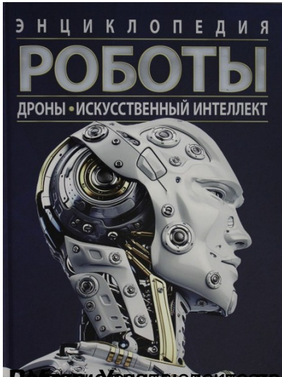
Познавательная литература: новинки - Роботы. Энциклопедия / У. Петтер и Морей / Росман, 2022